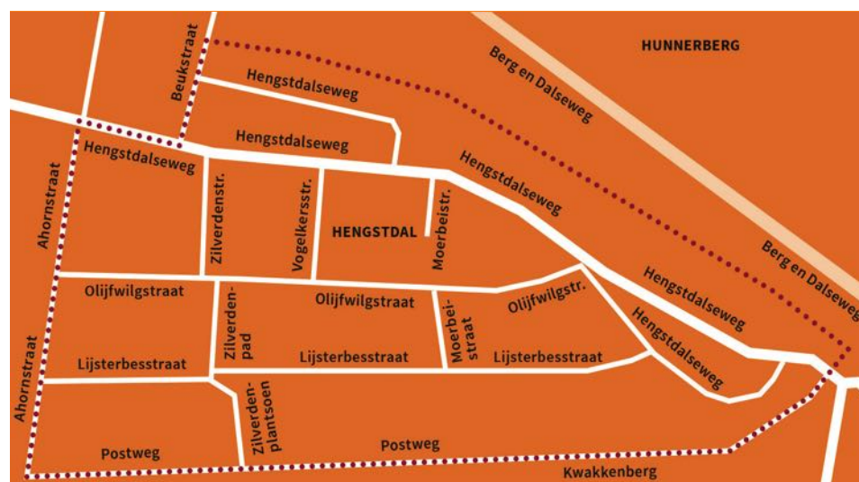
Stippellijn is grens van BES projectgebied

Als bewoner heeft u bij een BES zeggenschap over uw eigen warmte. Meer dan dat u zou hebben als u van een groot bedrijf warmte afneemt. Er zijn al veel voorbeelden van coöperaties. Met een buurtcoöperatie heeft u zeggenschap over de bron die uw huis gaat verwarmen en er is transparantie over kosten. ■